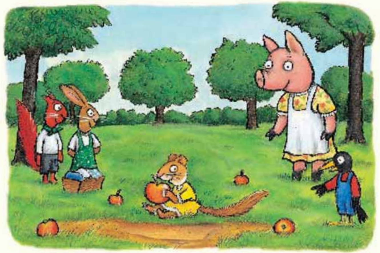
Relmuis eet vijf appels.