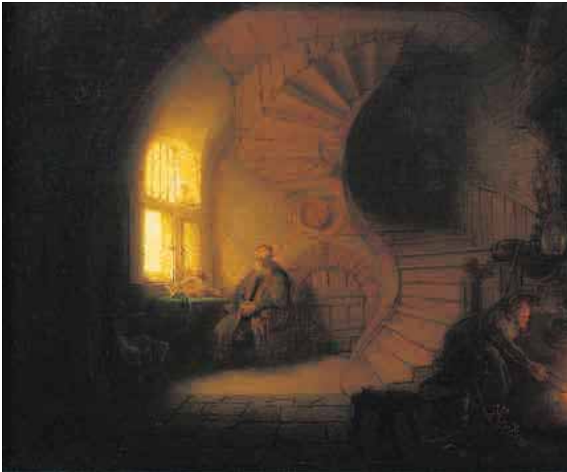
Rembrandt (1606-1669), Filosoof in meditatie (1632), Parijs, Louvre.

De slechtste leraar is zonder twijfel de filosofische ambtenaar: hij kan zich niet losmaken van het officiële leerprogramma en zijn lessen zijn op negen begrippen gebaseerd – de natuur, de kunst, de vrijheid, het recht, de rede, het bewustzijn, de geschiedenis en de waarheid – en op een reeks filosofen: een dertigtal verzamelde werken, uiteenlopend van Plato (427-347 v.Chr.), de oudste, tot Heidegger (1889-1976), die het kortst geleden is gestorven, want in schoolse zin is een goede filosoof een dode filosoof... Deze ramp voor het onderwijs wijkt geen seconde af van een oud, naargeestig leerboek, van een leergang die jaren geleden is samengesteld, en begeeft zich absoluut niet buiten de platgetreden paden van de geschiedenis van de filosofie. Hij leert je ver-