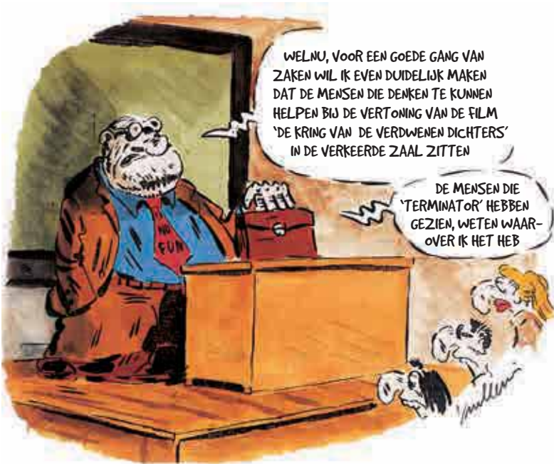
Vuillemin, cartoon in Phosphore (1998).